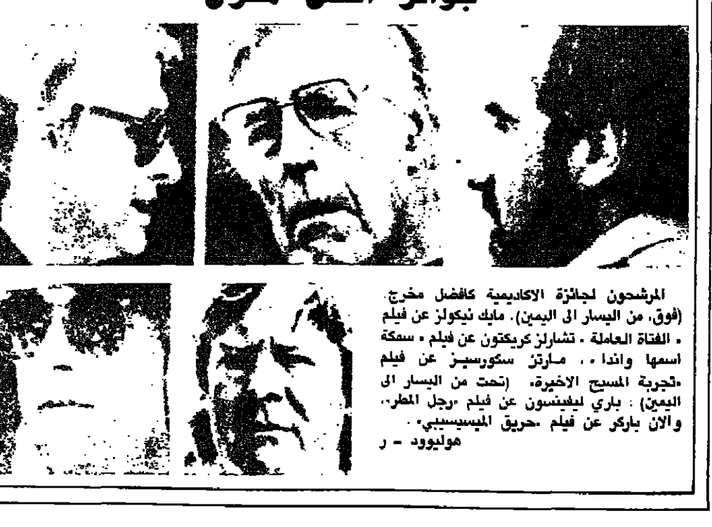
المرشحون لجائزة الاكاديمية كافضل مخرج (فوق، من اليسار إلى اليمين): مايك نيكولز عن فيلم الفتاة العاملة - تشارلز كريكتون عن فيلم سبعة أسماء واندرا - مارتن سكورسيز عن فيلم تجربة المسيح الأخيرة، (تحت من اليسار إلى اليمين): باري ليفنسون عن فيلم رجل المطر، والان باركر عن فيلم حريق الميسيسيبي، هوليوود - ١ ف ب